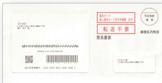
【Ficha de notificación】 (Frente)