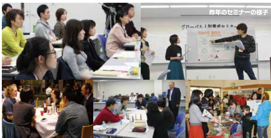
昨年のセミナーの様子