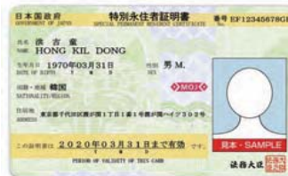
特別永住者証明書